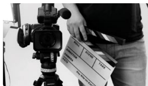
Creación y Contenido Audiovisual