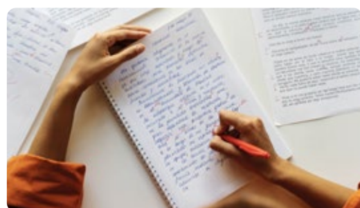
Ortografía y redacción