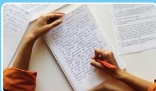
Ortografía y redacción