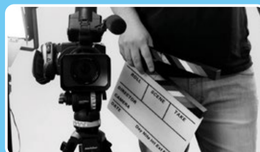
Creación y Contenido Audiovisual